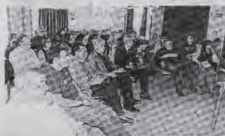
I partecipanti al corso (Osti)

NUMERI UTILI 0375 PREFESSO 200493 Redaz. Casalimaggiore 201466 Fax redazione 2811 Copidat 42000 Carabinieri 42288 Polizia stradale 40540 Polizia municipale 43784 Gas