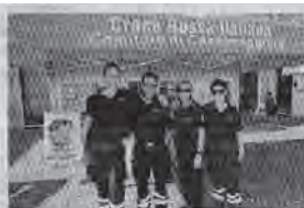
Quattro volontari al gazebo sul mercato